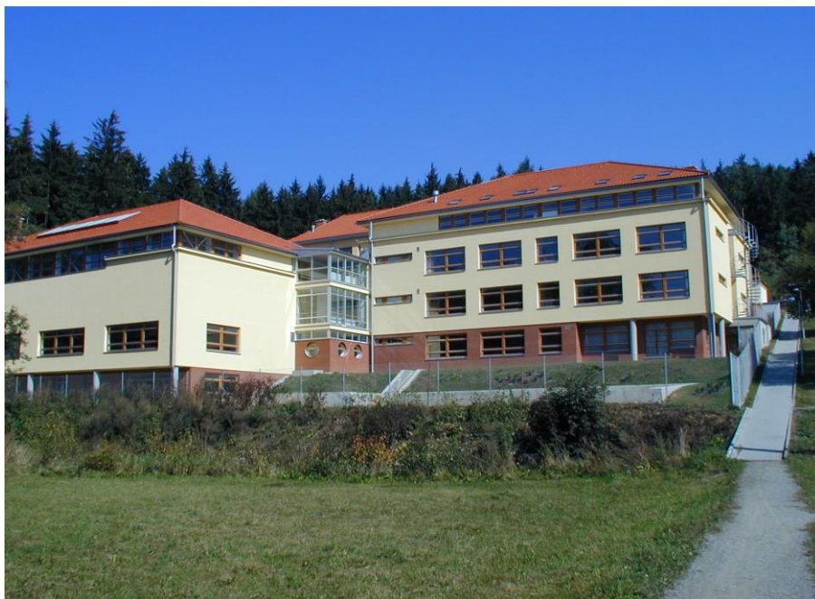
Obvyklá fotografie na úvod